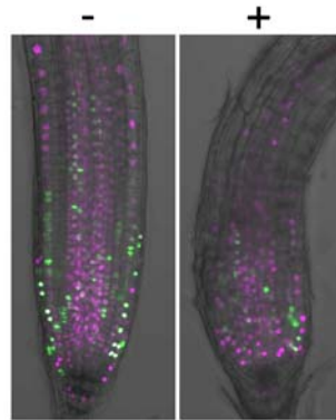
図 3. 細胞周期を可視化させたシロイヌナズナの根

細胞分裂では、細胞が実際に分裂する時期（M 期、M = 「分裂」を意味する Mitosis の頭文字）の他に、DNA を複製して分裂に備える時期（S 期、S = 「合成」を意味する Synthesis の頭文字）と、それぞれの間中期（G1・G2 期、G = 「間」を意味する Gap の頭文字）があります。これらの時期（細胞周期）が繰り返されることで、細胞は分裂を続けます。chem7 がどの時期を阻害するのかを調べるために、2 色の蛍光タンパク質を使って細胞周期の進行を可視化させたシロイヌナズナを用いました。このシロイヌナズナの根では、さまざまな時期の細胞が混在しているため、どちらの色の細胞も観察されます（図 3）。この根に chem7 を投与したところ、両色が混在したまま、光る細胞が存在する領域（細胞分裂活性の高い組織）が小さくなりました（図 3）。このことから、この化合物は、特定の細胞周期を標的とするわけではなく、どの時期の細胞に対しても阻害効果を発揮できると考えられます。つまり、chem7 は細胞周期の時期にかかわらず、急速に細胞の活性を停止させることで、細胞や組織の形をゆがめることなく、成長を止めることができるのではないかと推察されます。さらに、chem7 を添加して細胞分裂を阻害した根や培養細胞からこの化合物を洗い流すと、再び細胞分裂を始めることができました。このことから、この薬剤は細胞分裂を停止させている間でも、復旧できないほどの重篤な異常は引き起こさないことが分かりました。