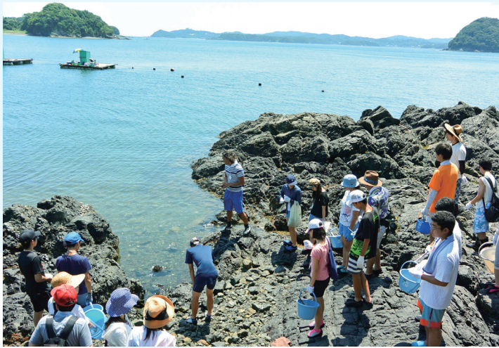
ひらめき☆ときめきサイエンス(中高生対象の日帰り実習)での磯観察風景