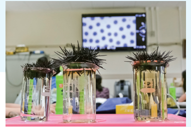
臨海実習でのウニの受精実験の一コマ

ウニやホヤの受精やその後の成長、磯にいるたくさん的小型動物の採集など、ここで海洋生物学に触れてその後、