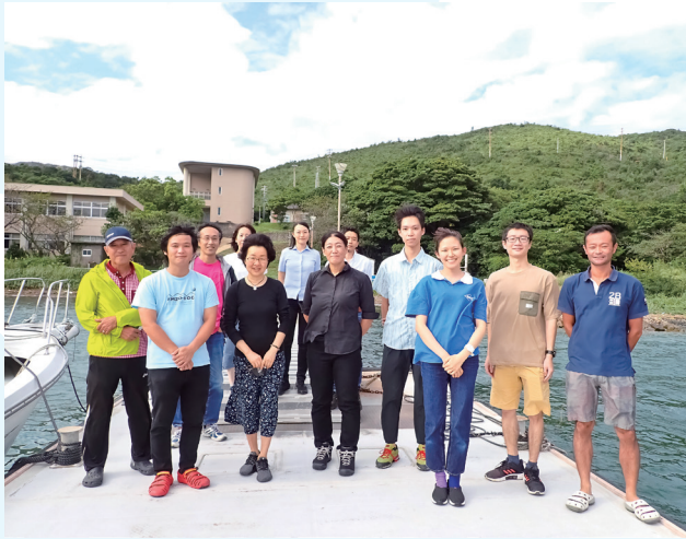
菅島臨海実験所のメンバー