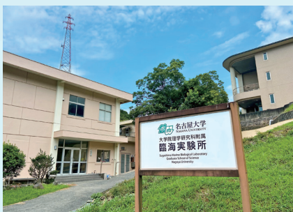
菅島にある名古屋大学菅島臨海実験所

いかもありません。私たちの実験所は、町とは正反対の島の南西部にあります。近くに民家はなく、「お隣さん」には山を越えて50分歩いて、ようやくお目にかかることができます。 いつの間になんかところに実験所を建てたの？と思われるかたもいらつしやるかもしれません。実は82年も前、昭和14年（1939年）のことです。それ以来、世界的に著名な研究者たちや多くの学生が在籍しました。所員は実験所内の宿泊施設に住み込むか、実験所所有の船で中之郷桟橋から通勤して、研究と教育活動に励んできました。 もし中之郷で「名古屋大学 Nagoya University」と書かれた船を見られたら、それは私たちの通勤船です。