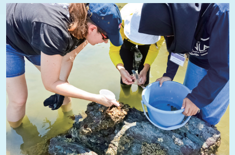
国際臨海実習での磯採集の様子 菅島の磯の生物を観察しました