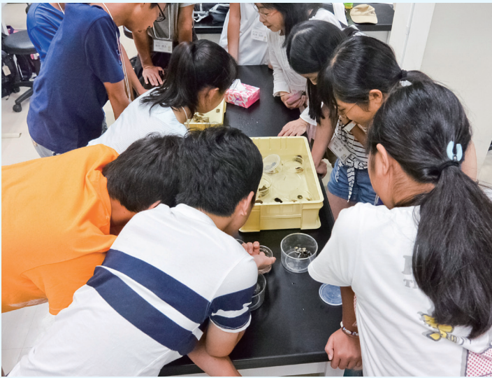
ひらめき☆ときめきサイエンス(中高生対象の日帰り実習)での磯採集動物の観察風景

研究者の道を選んだ子どもたちもいたはず。この2年間はコロナ禍でほとんど受け入れることはできませんでしたが、コロナが収まればまた再開したいと思っています。