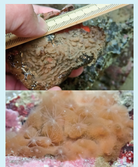
テンプライソギンチャク

が実験所前で見つかりました。鳥羽水族館の「へんな生き物研究所」コーナーで飼育されていますからご存知のかたもいらっしゃると思います。国立大学の臨海実験所は20か所以上ありますが、ここまでの人間の経済活動が周りにない環境にあり続けているのは、菅島臨海を置いてほかにありません(もつとも、令和の時代なのに郵便を取りに行くのにも操船が必要という不便さの裏返しなのですが…)。ここからも「へんな生き物」がここでたくさん見つかるものと確信しています。