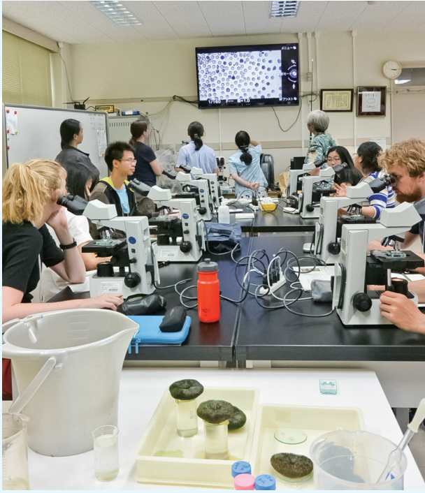
国際臨海実習でウニの受精発生実験の様子 各国から学生が集まっています

「大学の臨海実験所で海洋生物の研究をしている」と言ったら、多くのかたが魚の研究を想像されると思います。